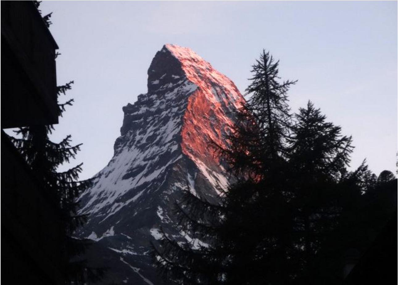
In der Dämmerung