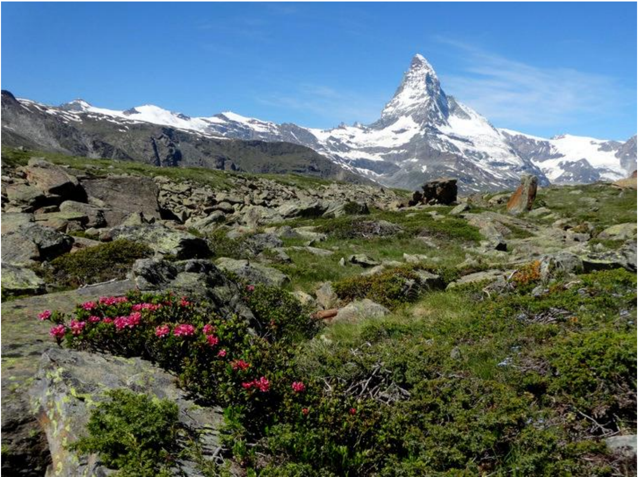
Steinig, aber wunderschön