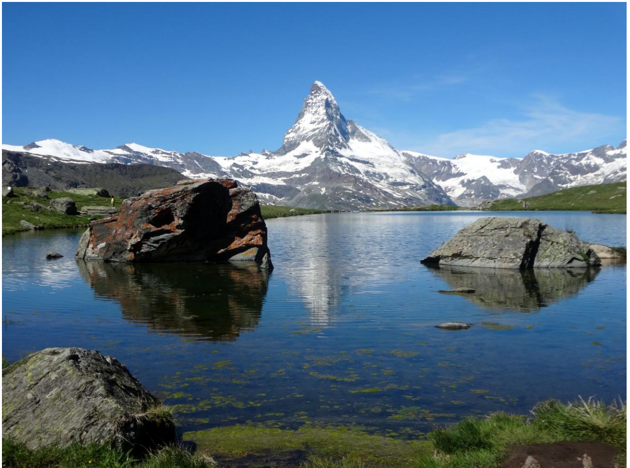
Das Matterhorn spiegelt sich im Stellisee