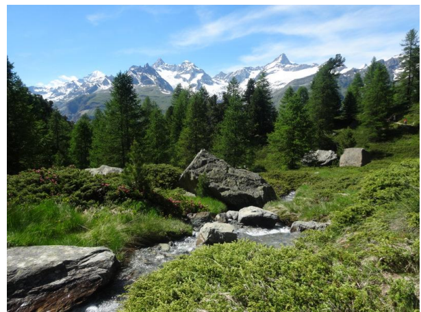
Alpenrosen mit Panorama