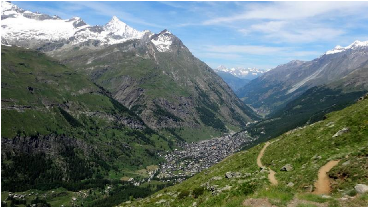
Zermatt von oben